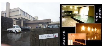
湯らくの宿 のしろ