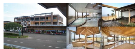
2 日宿泊施設「ハタハタ館」