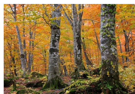
白神山地の黄葉(イメージ)

コース：白神山地を代表する景勝地“青池”に代表される 黄葉の十二湖周辺をトレッキングします。